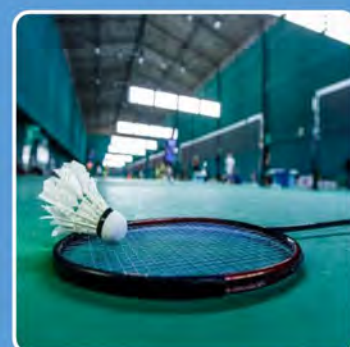
Sports & loisirs

250 activités / de nombreuses nouveautés www.alep.asso.fr