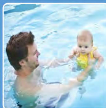
Enfants & bébés