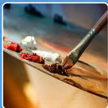
Art & artisanat